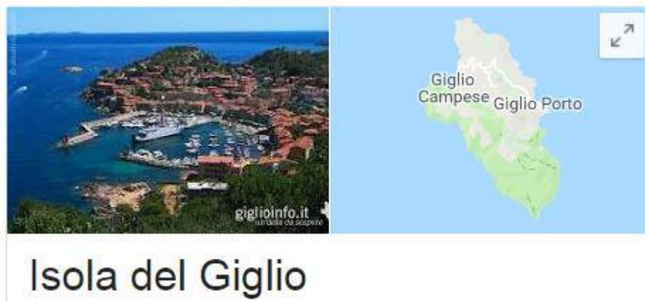
Isola del Giglio

L'Isola del Giglio è un comune italiano a carattere sparso di 1 426 abitanti della provincia di Grosseto in Toscana. Prende il nome dall'omonima isola dell'Arcipelago Toscano e comprende anche l'Isola di Giannutri, situata alcuni chilometri a sudest. L'isola deve il suo nome, sin dall'Antichità classica, alla presenza di capre (àighes): Aigyllion (in greco Αιγύλλιον) con la successiva trasformazione latina Igilium che nel Medioevo diventò Gilio. Al Comune sono state attribuite le 4 Vele di Legambiente nella Guida Blu 2012.