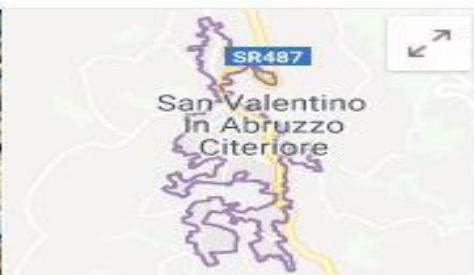
San Valentino in Abruzzo Citeriore Comune italiano

San Valentino in Abruzzo Citeriore è un comune italiano di 1.918 abitanti della provincia di Pescara in Abruzzo. Dopo la scomparsa del comune di Pino sulla Sponda del Lago Maggiore per fusione nel nuovo comune di Maccagno con Pino e Veddasca con il quale deteneva il primato, è il comune italiano dal nome più lungo, essendo composto da 30 caratteri esclusi i nomi ufficiali dei comuni bilingui e trilingui.