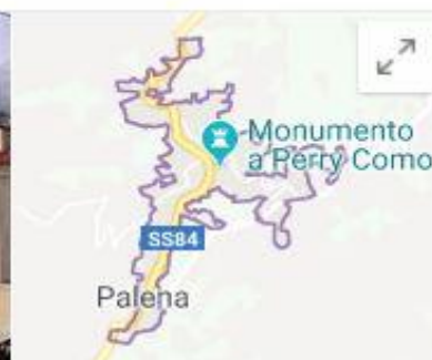
Palena Comune italiano

Palena è un comune italiano di 1.400 abitanti della provincia di Chieti in Abruzzo., Il nome del centro abitato pare derivare da "pala" ossia prato in forte (erto) pendio.