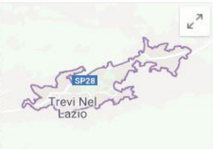
Trevi nel Lazio Comune italiano

Trevi nel Lazio è un comune italiano di 1.790 abitanti nella “ciociara” laziale.