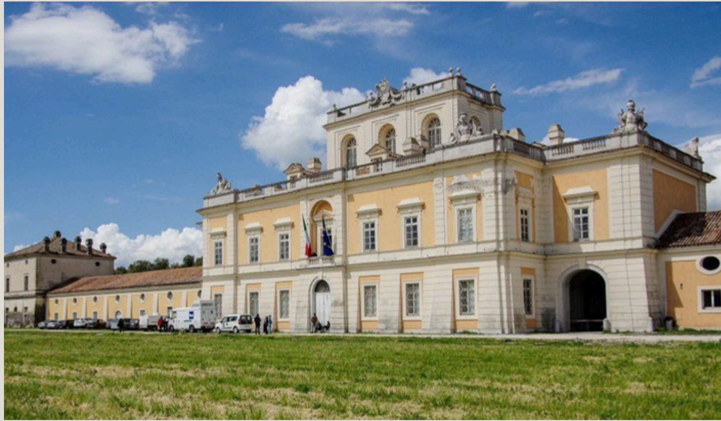
Real sito di Carditello