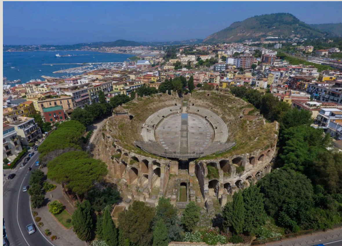
Parco regionale dei Campi Flegrei