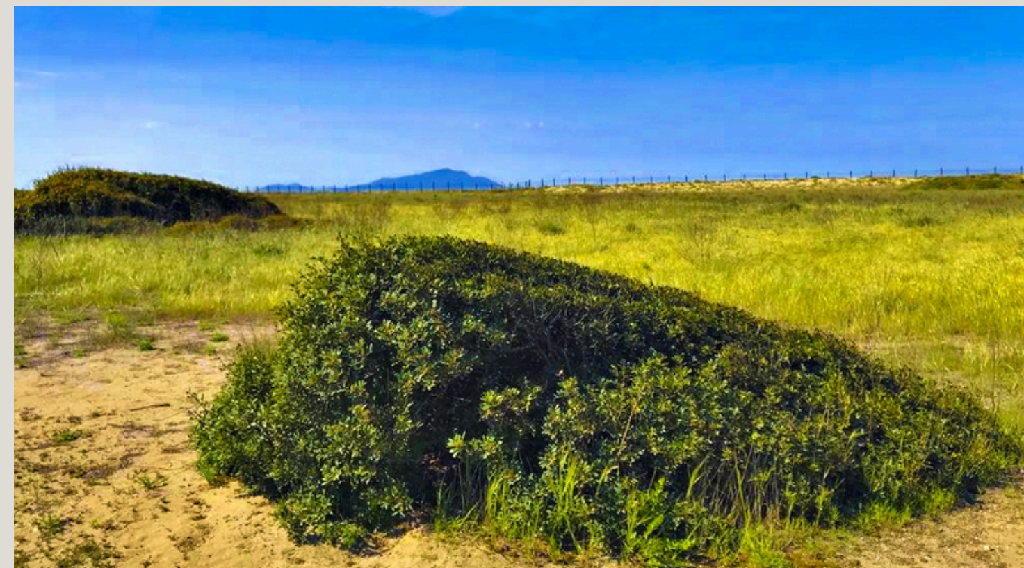
Riserva statale di Castel Volturno